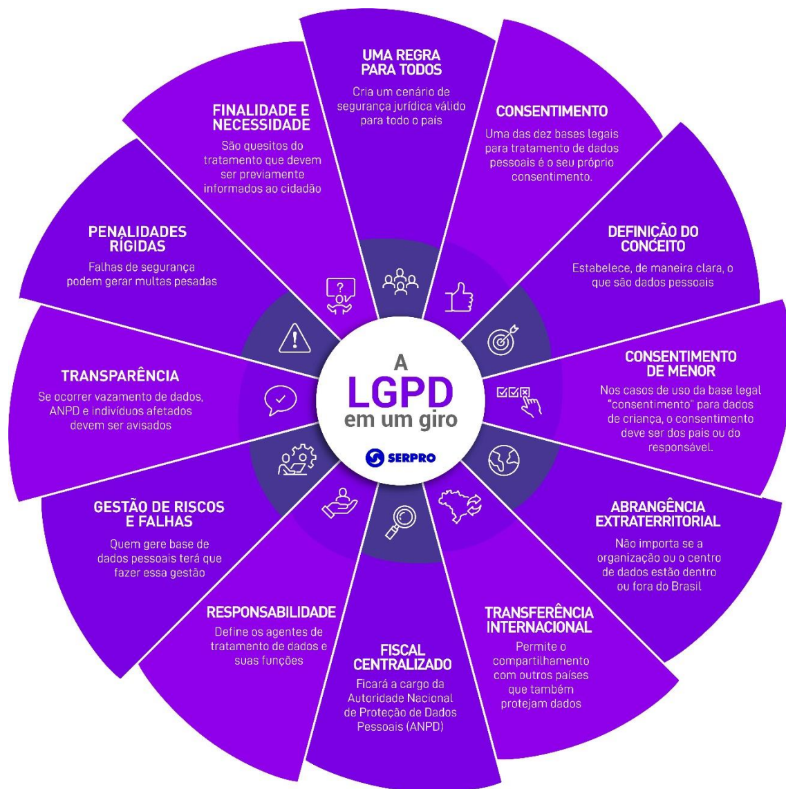
Figura 1 – A LGPD em um giro