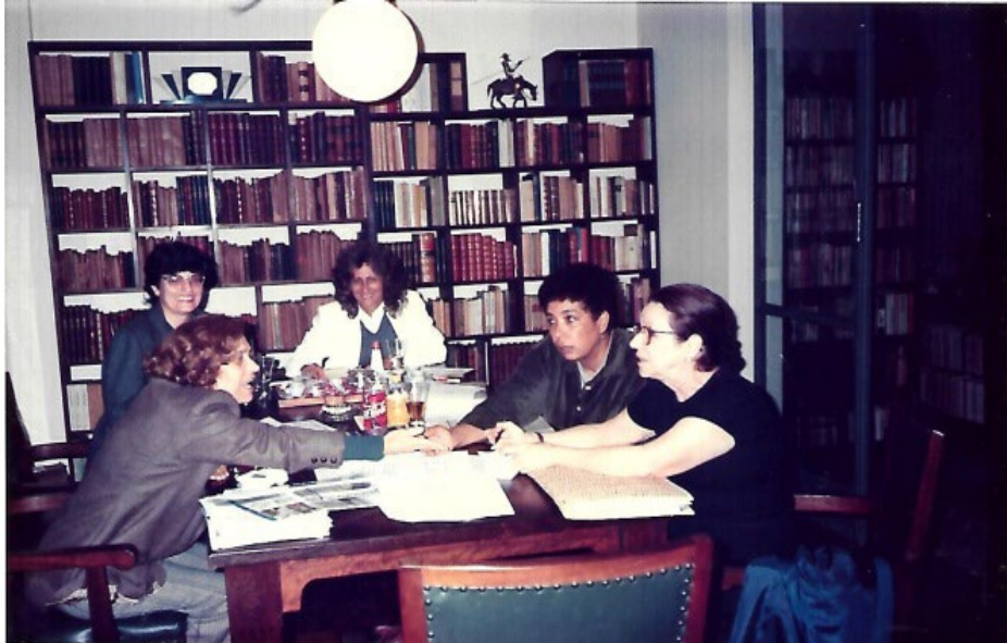
Imagem 7 - Reunião com a presença da Professora Heloísa para finalização das atividades a serem desenvolvidas no XII Congresso Brasileiro de Arquivologia, 1998.

No ano de 1996, quando da realização do XI Congresso Brasileiro de Arquivologia, realizado no Hotel Glória, Rio de Janeiro, a Paraíba foi o Estado escolhido para sediar o XII Congresso Brasileiro de Arquivologia através do Núcleo recém-criado. Como Diretora AAB - Núcleo Regional da Paraíba, assumi a responsabilidade de organizar o XII Congresso. O nordeste brasileiro era muito pouco privilegiado com a participação dos Congressos de Arquivologia. Com dificuldades de organizar a programação do XII Congresso Brasileiro de Arquivologia, - à época sem internet e a comunicação através dos Correios e Telégrafos -, resolvi escrever uma carta para Heloísa Bellotto, arquivista de notável prestígio nacional e internacional solicitando a sua ajuda. Qual foi a minha surpresa? Mesmo convalescente, se recuperando de uma cirurgia, de pronto me respondeu - também através de carta - com a relação de nomes e endereços de vários profissionais da Arquivologia do Brasil e do estrangeiro que poderiam ser convidados.