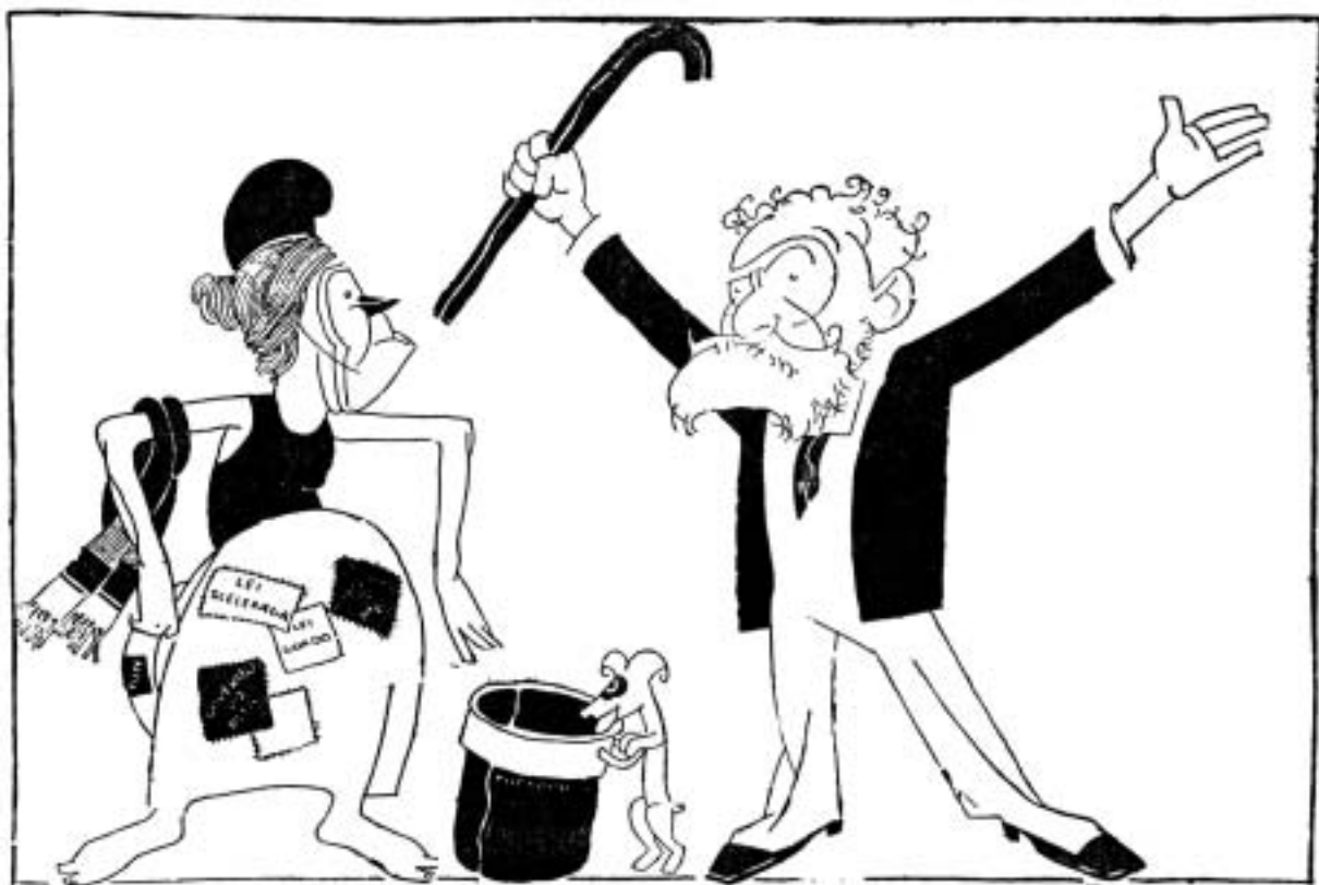
Velhice Precoce A República: - Meu Pai! Deodoro: - Você? Minha Filha? Com 38 anos e neste estado? Charge de Guevara (Manhã, 7-8-1927). In: LIMA, Hermes. História da caricatura no Brasil . Rio de Janeiro: Livraria José Olympio Editora, 1963.

oligarquia de São Paulo no controle dos rumos do novo regime, resultando em consequência duas presidências militares e três paulistas. Em que pese a participação de outros Estados, inclusive Minas Gerais, na sustentação do regime, a República era claramente controlada pelas elites paulistas, reunidas no forte Partido Republicano Paulista (PRP), tendo como aliados os militares. 11