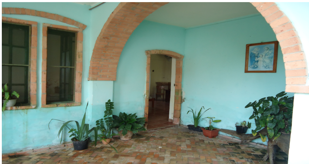
Imagem 2: A sala

Nele foram inseridos alguns banners que retratavam, em pequenos textos com imagens da época, a história daquele espaço e da cidade de Tefé.