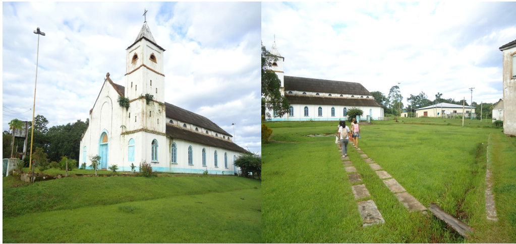
Imagem 1: O prédio