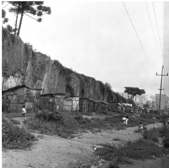
Foto 3 – Fotografia da década de 1960: foto da antiga Favela do Pindura Saia onde será observado qual a composição urbana e o tipo de moradia que compunha a favela que posteriormente cede lugar ao bairro Cruzeiro.