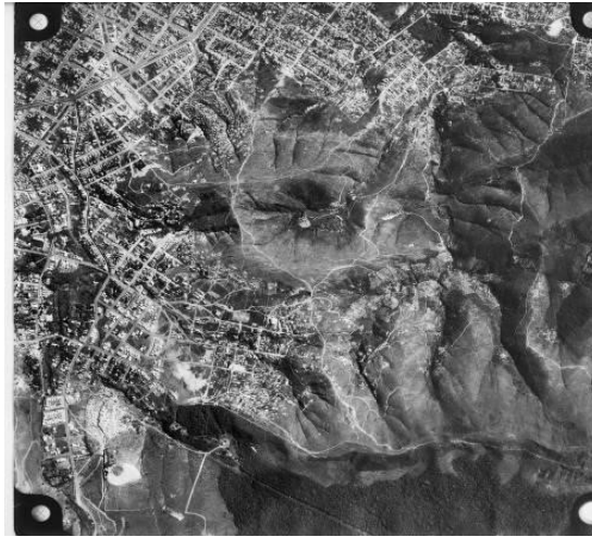
Foto 1 – Foto aerofotogramétrica do ano de 1953: será analisada a composição do espaço geográfico que se conhece hoje como Aglomerado da Serra.