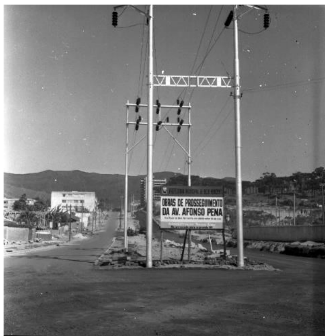
Foto 4 – Foto de obra municipal: será observada a expansão do território e também um reconhecimento de local.