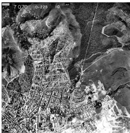
Foto 2 - Foto aerofotogramétrica do ano de 1967: análise sobre o desenvolvimento do espaço e o crescimento urbano.