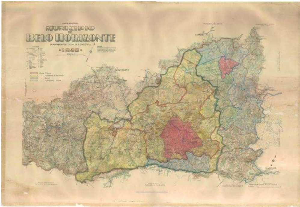
Mapa 2 – Mapa da década de 1940 – Será feito um comparativo com o MAPA 1 em relação ao crescimento da cidade, para além da zona urbana delimitada.