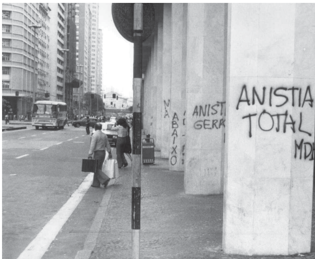
Pichação na cidade do Rio de Janeiro, 1979.

Concluída a fase de análise, investigação e julgamento dos processos, a CEMDP se concentrou em dois outros procedimentos. O primeiro deles, iniciado em setembro de 2006 e já concluído, foi a coleta de amostras de sangue dos parentes consanguíneos dos desaparecidos ou dos mortos cujos corpos não foram entregues aos familiares, constituindo assim, um banco de dados de perfis genéticos – Banco de DNA – visando à comparação e identificação com certeza científica dos