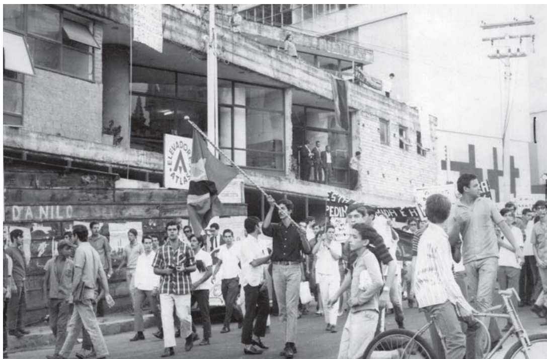
Passeata dos estudantes cariocas contra o descaso do governo do estado nas obras do restaurante Calabouço. Rio de Janeiro, 29 de março de 1968.

A terceira linha de atuação do Projeto, a exposição fotográfica “A ditadura no Brasil 1964 – 1985” recupera, de maneira exclusiva, desde os primeiros momentos do Golpe de Estado que mergulhou o país numa ditadura de 21 anos, até os grandes comícios populares das “Diretas Já”. Imagens marcantes dos tanques militares na frente do Congresso Nacional, as passeatas estudantis, a resistência dos diversos grupos da sociedade civil, a censura de documentos, a violência, prisões e torturas estão expostas em grandes