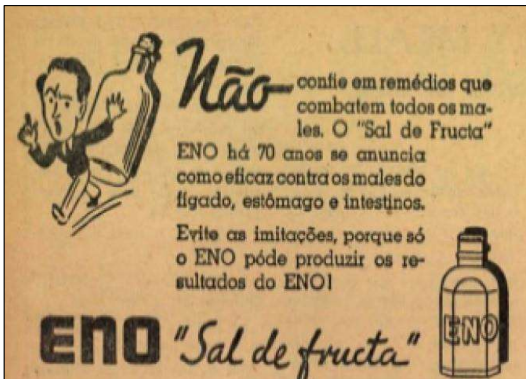
Figura 6 - Revista Alterosa – Anúncio Sal de Fruta Eno 1943/ago.