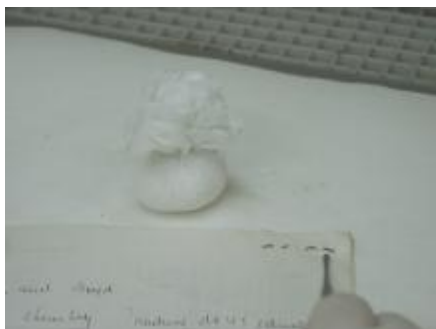
Remoção de grampos