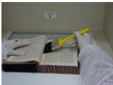
Higienização do miolo