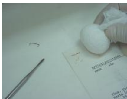
Retirando a sujeidade