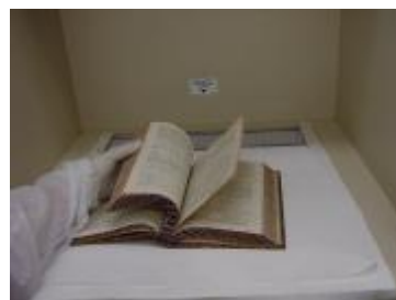
Oxigenação da obra