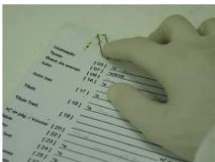
Remoção de cliques