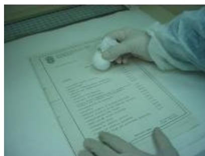
Higienização com pó de borracha