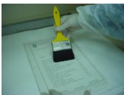
Higienização com trincha