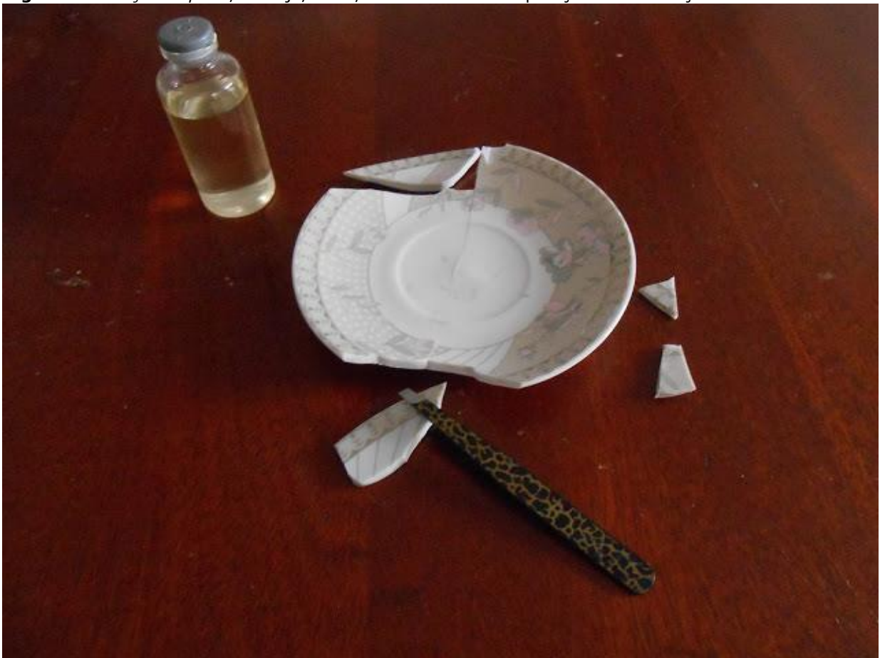
Figura 9: Pedaços de pires , Khadija, 2015; foto-conceito "Recuperação da informação".