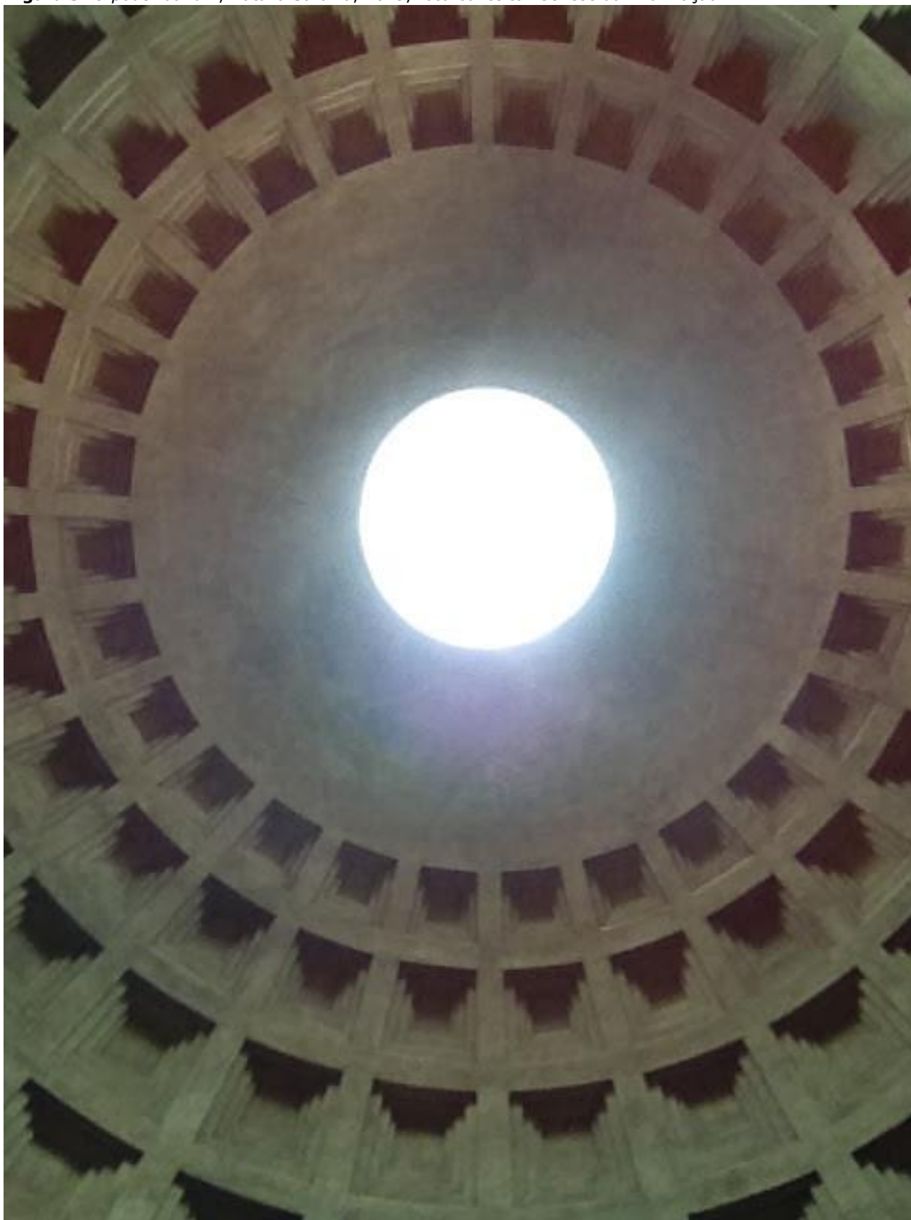
Figura 3: O poder da luz! , Natália Saraiva, 2015; foto-conceito "Gênese da informação".