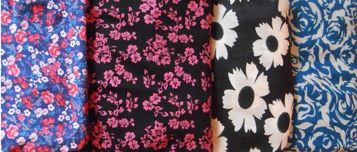
Figura 4: Primavera de vestir, Khadija, 2015; foto-conceito "Organização da informação".