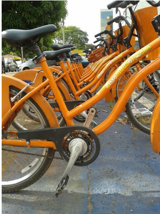
Figura 6: Ordenação sustentável , Elaine Américo, 2015; foto-conceito "Organização da informação".