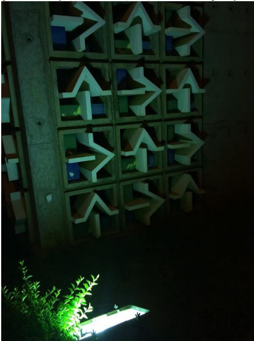
Figura 5: Organizando a direção, Natália Saraiva, 2015; foto-conceito "Organização da informação".