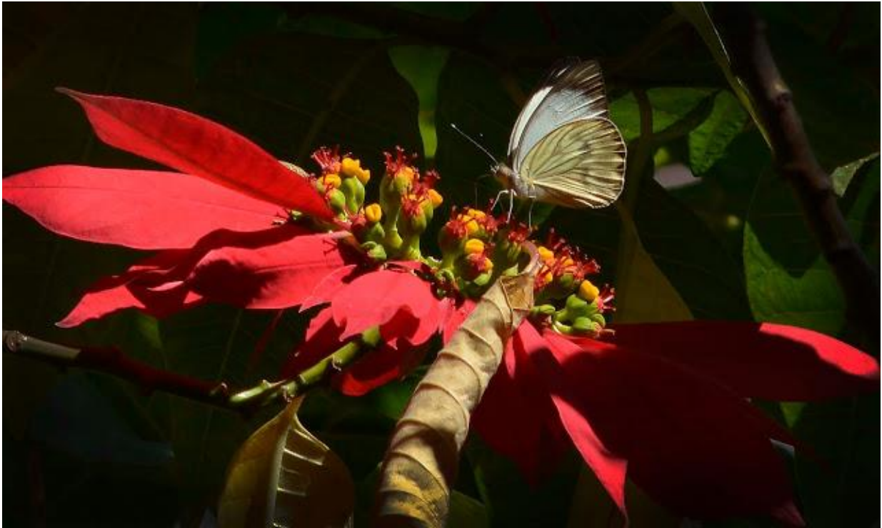
Figura 8: Recuperação da informação , Duda Bentes, 2015; foto-conceito "Recuperação da informação".