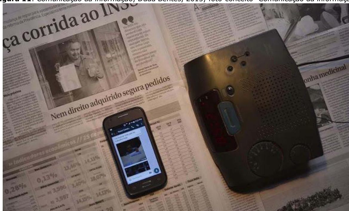
Figura 11: Comunicação da informação , Duda Bentes, 2015; foto-conceito "Comunicação da informação".