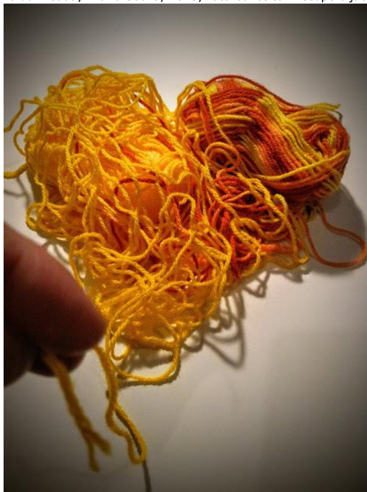
Figura 10: O fio da meada , Bruno Souza, 2015; foto-conceito "Recuperação da informação".