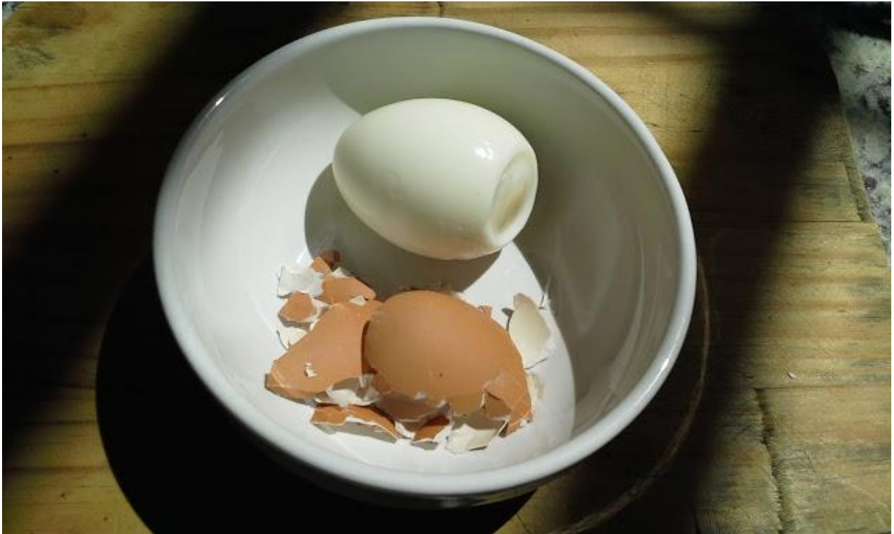
Figura 1: Informação , Duda Bentes, 2015; foto-conceito "Informação".