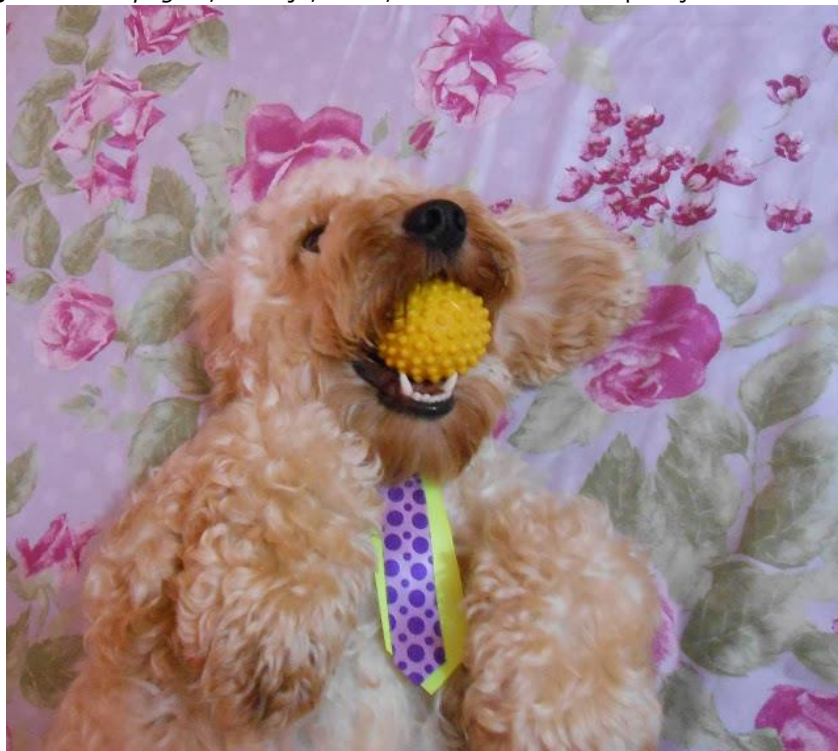
Figura 7: Vai pegar! , Khadija, 2015; foto-conceito "Recuperação da informação".