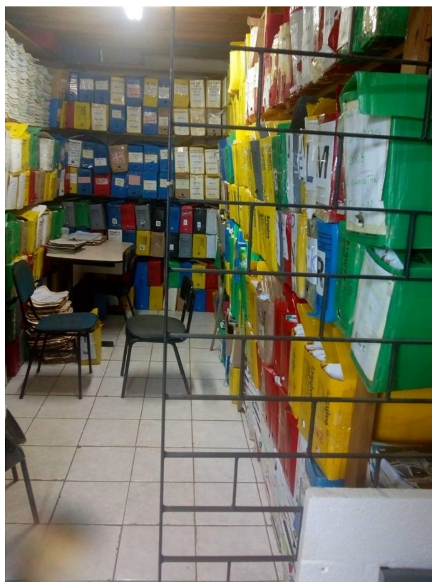
Figura 1 - Espaço onde os documentos estão armazenados no CEBB.