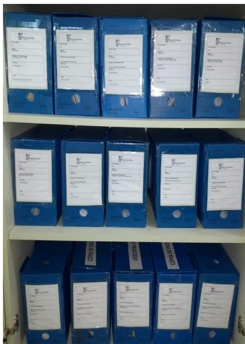
Figura 6: Caixas de Processos