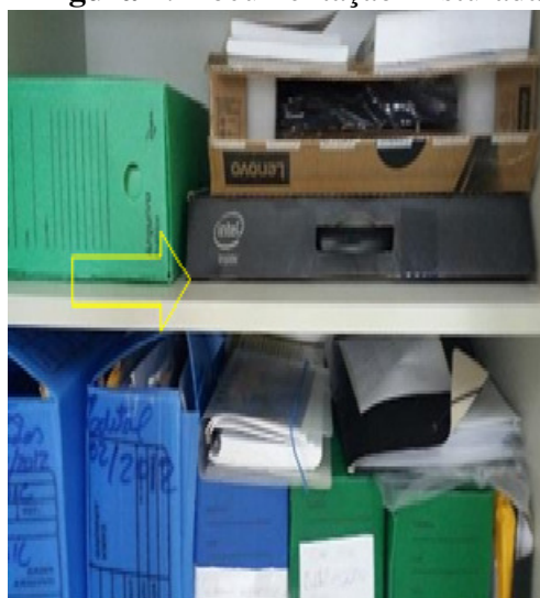
Figura 4: Documentação misturada