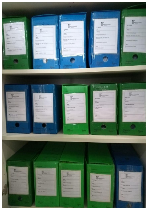
Figura 5: Caixas de Projetos de Pesquisa