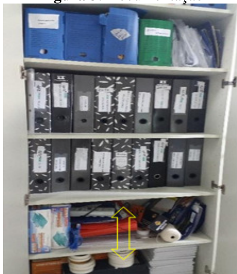
Figura 3: Documentação

FUNCEFETSE, Termo de Parceria Votorantim, Autorização de Serviços Petrobras, Solicitação de Diárias e Passagens, Livro de Protocolo, Solicitação de Transferência de Bens e Processos de Pagamentos. A ordenação destes eram basicamente por ano e separados por espécie/tipo documental posicionado de forma vertical e horizontal. As identificações das caixas estavam sem a padronização instituída no Manual para Organização dos Arquivos Setoriais, aprovado pela portaria nº 0270, 29 de janeiro de 2015. Além disso, existiam caixas em cima dos armários identificadas com documentos diversos e outras sem identificação, conforme imagens da situação encontrada durante o diagnóstico.